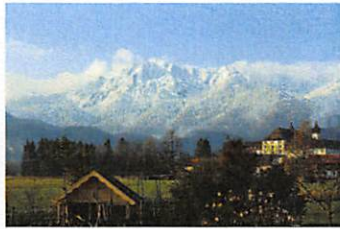
Blick vom Garten zum Herzogstand